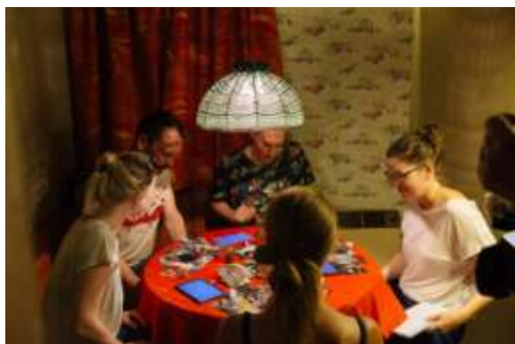
ZAOSTAVŠTINA, KOMADI BEZ LJUDI