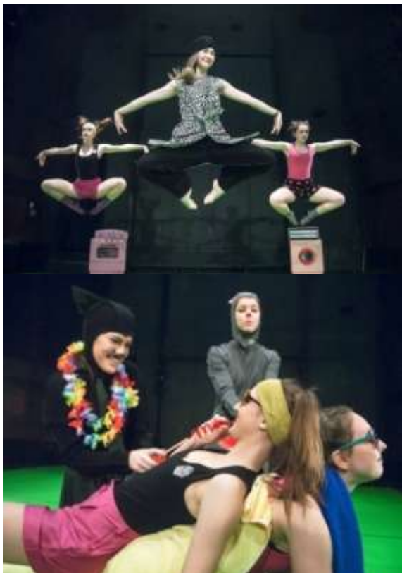
Premijera: 25. decembar 2017. godine, BITEF teatar https://youtu.be/dqzNJZESObc