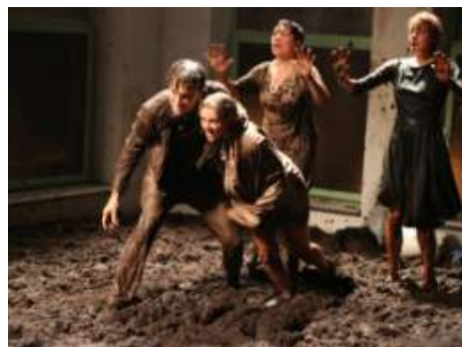
NO43 PRLJAVŠTINA

Režija i adaptacija teksta: Oliver Frljić