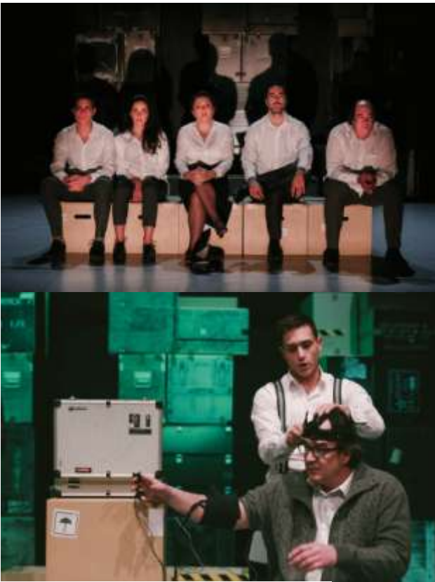
Premijera: 21. januar 2017. godine, BITEF teatar

BITEF TEATAR, BEOGRAD, SRBIJA I ART HUB – UDRUŽENJE ZA ISTRAŽIVANJE I PODSTICANJE IZVEDBENIH UMJETNOSTI SARAJEVO, BOSNA I HERCEGOVINA