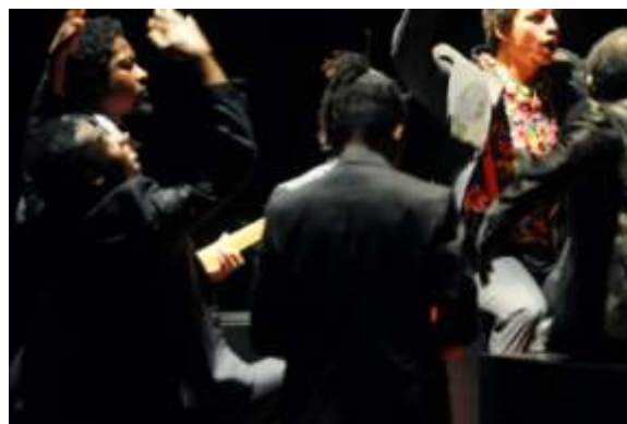
REKVIJEM ZA L

Koncept: Štefan Kegji, Dominik Iber (Rimini Protokol)