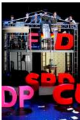
GORKI - ALTERNATIVA ZA