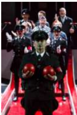
ODILO. ZATAMNENJE. ORATORIJUM, Foto: Nada Zgank Producent: Slovensko mladinsko gledališče, Centar za urbanu kulturu „Kino Šiška“, Ljubljana, Slovenija Autor: Peter Mlakar, Dragan Živadinov Režija: Dragan Živadinov