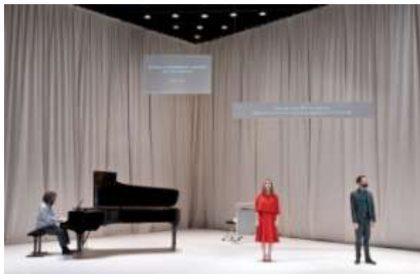
SVITA BR. 3 EVROPA, Foto: Frédéric Lovino Producent: Ešel 1:1, Pariz, Francuska Koncept: Kolektiv „Enciklopedija reči“ Režija, kompozicija i režija: Žoris Lakost Kompozicija i muzika: Pjer-Iv Mase