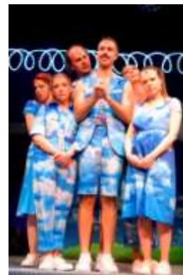
BOLIVUD Producent: Narodno pozorište u Beogradu, Srbija Autor: Maja Pelević Režija, tekst i režija: Maja Pelević