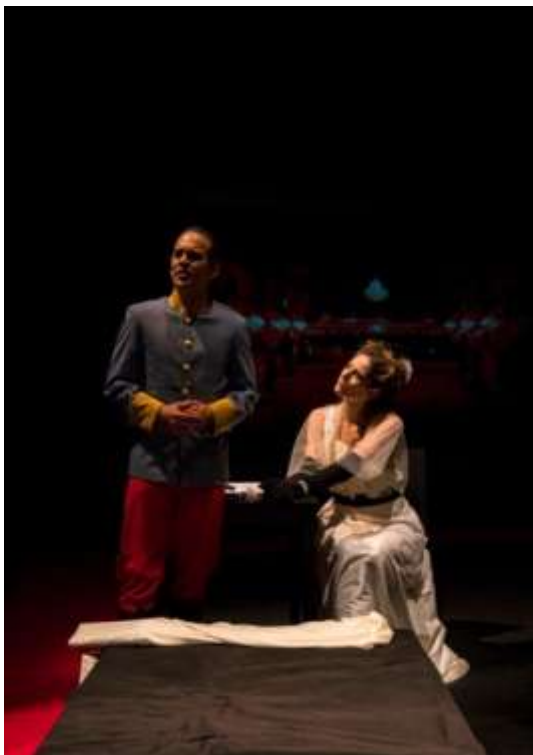
Premijerno izvođenje u Beogradu: 31. oktobar 2018. godine, Scena BITEF teatra Premijerno izvođenje u Subotici: 6. novembar 2018. godine, Pozorište Kostolanji Deže / Kosztolányi Dezső Színház