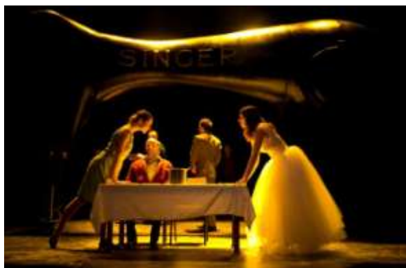
ŠESTLICA RAŽPISKA

Producent: Satiričko kazalište „Kerempuh”, Zagreb,